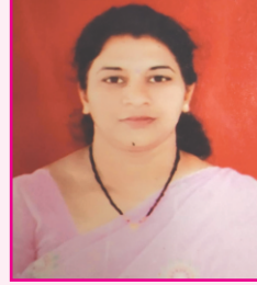
प्रमुख संपादक - डॉ. ए. व्ही. भोसले