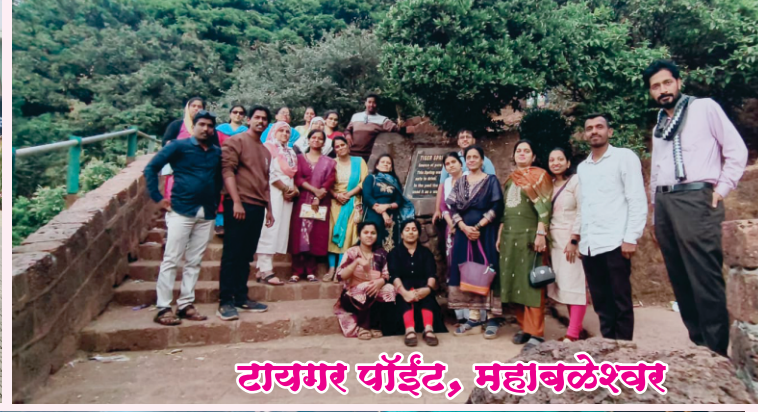
टायगर वॉर्डेट, महाबलेश्वर