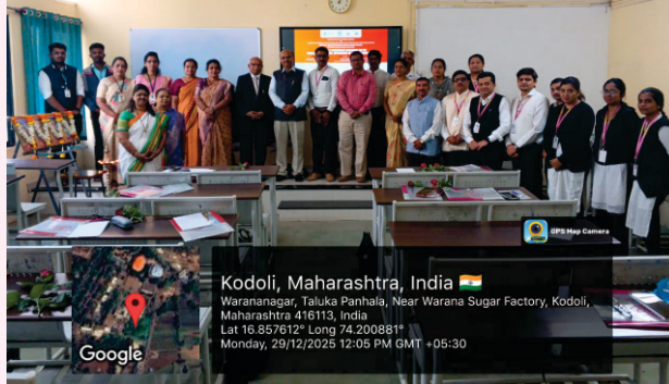
Kodoli, Maharashtra, India Warananagar, Taluka Panhala, Near Warana Sugar Factory, Kodoli, Maharashtra 416113, India Lat 16.857612° Long 74.200881° Monday, 29/12/2025 12:05 PM GMT +05:30

शिवाजी विद्यापिठ कोल्हापूर व ताल्यासाहेब कौरे फार्मसी-विद्यालय, वारणानगर एक दिवसीय सेमीनार Mentor-Mentee, PARIS PRASH YOJANA Scheme अंतर्गत महाविद्यालयाचा सहभाग