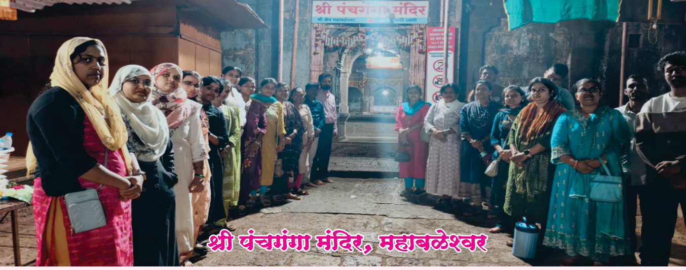
श्री पंचगंगा मंदिर, महाबलेश्वर