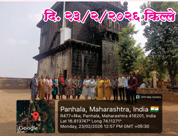
दि. २३/२/२०२६ किल्ले पन्हाळा EPC - 4