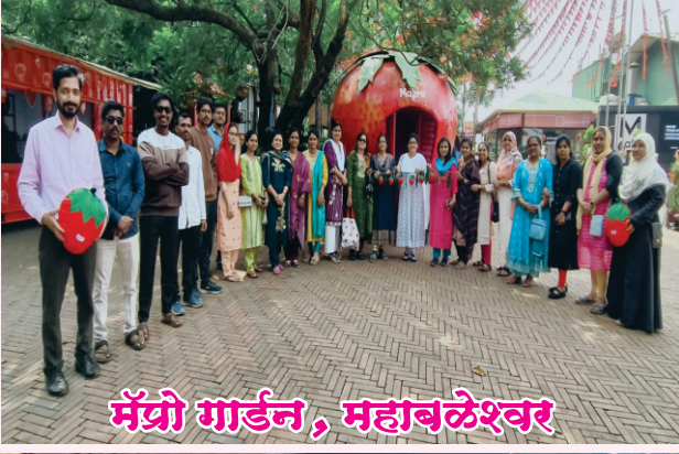
मॅट्रो गार्डन, महाबलेश्वर